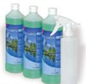
SET BIOACTIF NETTOYANT