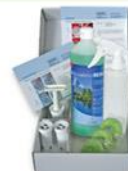
SET COMPLET NETTOYANT