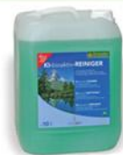
10 LITRES BIOACTIF NETTOYANT